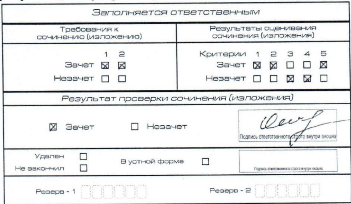
Рис. 10. Область для оценки работы