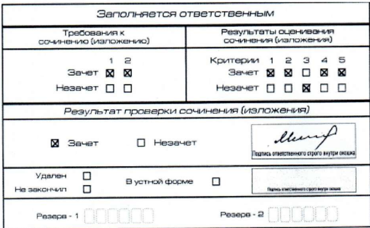
Рис. 11. Область для оценки работы