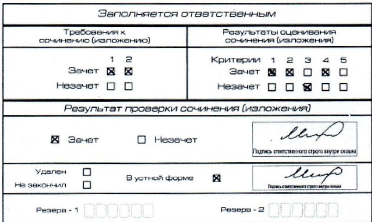
Рис. 12. Область для оценки работы сочинения (изложения) в устной форме

После окончания заполнения бланка регистрации ответственное лицо ставит свою подпись в специально отведенном для этого поле.